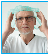
ggf. Haube aufsetzen