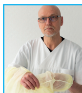
Kittel auf links ausziehen ohne Berührung des kontaminierten Außenbereichs