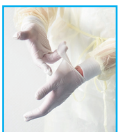
Handschuhe auf links ausziehen