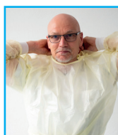
Kittel hinten fassen - öffnen durch aufreißen